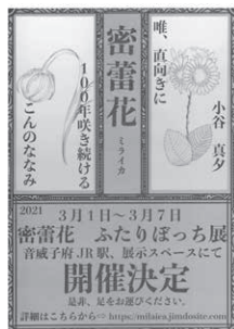
↑ふたりぼっち展ポスター

今回の作品展は、「未だ蕾（つぼみ）である自分たちが開花に向かうため、自分たちがどこまでできるのかを今一度確かめる気持ちで挑んだもの」なのだそうです。展示作品の制作にあたって、「直感的に感じたものだけでなく、作品を見た刺激を通して考察してみたり、またそうした方々と心を共有したい」と考え、作品制作に励んでいたとのこと。将来については、「作家として成長したら、また村で展示を行いたい」と話されました。