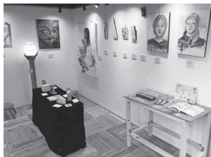
↑ふたりぼっち展 会場ようす

こんにちは、地域おこし協力隊の足立です。おといねっぶ美術工芸高校の生徒有志による作品展が2月末から3月にかけて、なんと2つも開催されました！ 各作品展の代表者の方々にそれぞれインタビューを行い、苦労した点や今後の展望などについて伺いましたので、ご紹介します。