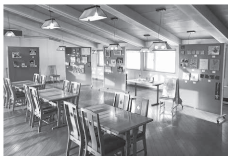
↑つどい展 会場ようす

「展示作品の制作と、メンバー集めや展示会場の確保、打ち合わせなどの同時進行を初めて経験しました。とても内容の濃い時間を過ごすことができました」