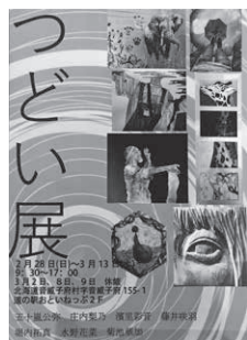
↑つどい展ポスター