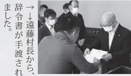
→遠藤村長から、辞令書が手渡されました。

6月21日（水）には役場庁舎にて就任式が行われ、それぞれ職務に就いていただきます。