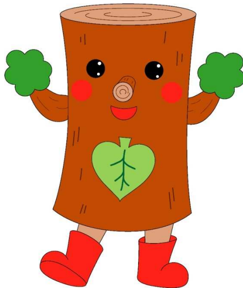
音威子府村公式キャラクター おとっきー