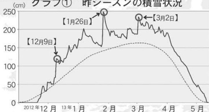
グラフ① 昨シーズンの積雪状況

昨シーズンは「雪が多かった」という印象がありますが、過去の記録や数値からみても、「ドカ雪」の多いシーズンだったことがわかります。