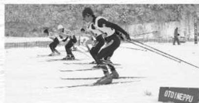
※20日、25日は開会式のみ行います。