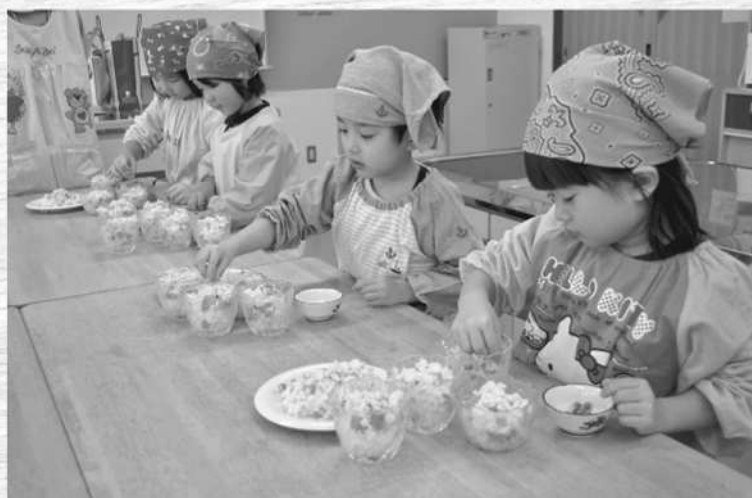
11月28日 親子料理教室

表紙は、親子料理教室での1コマです。大きな包丁を持って、お母さんや先生と一緒に野菜を切る園児、また真剣な面持ちで1人で野菜切りに挑戦している園児…。右側の写真は、「まぜまぜ寿司」にグリーンピースを盛り付けている様子です。