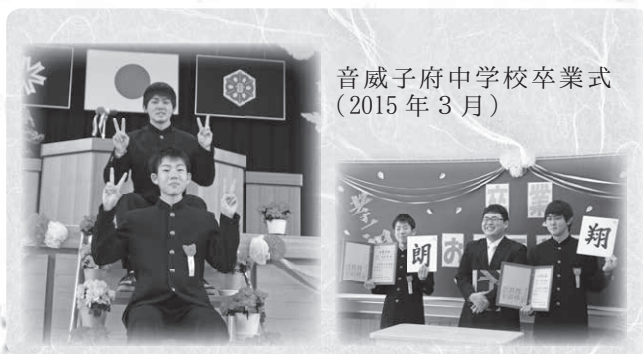
音威子府中学校卒業式 (2015年3月)