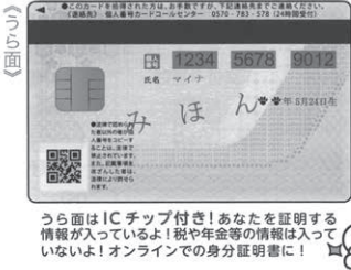
うら面はICチップ付き!あなたを証明する情報が入っているよ!税や年金等の情報は入っていないよ!オンラインでの身分証明書に!