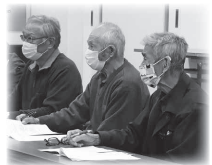
◇音威子府地区 実施日時11月30日18時 参加人数 7名