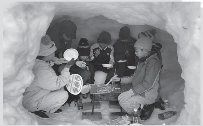
1回目(3段目の写真)の頃から行われている恒例の豚汁づくり&かまくらバーベキュー