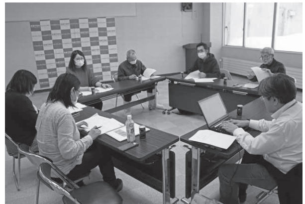
☎ 協議会事務局(総務課地域振興室) ☎ 5 - 3311