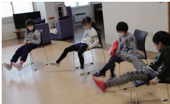
↑激しい動きで笑わせてくれる子ども達